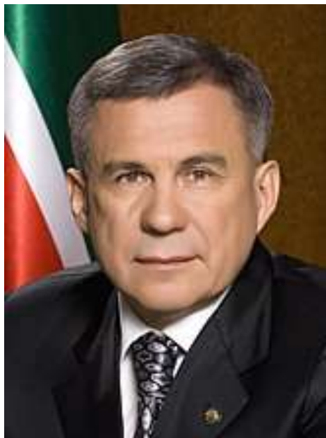
и.о.Президента Республики Татарстан

Умение договориться в интересах республики в самых сложных ситуациях, общественное согласие и здравый смысл сделали политику высшего политического руководства республики понятной и открытой для всех.